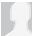
Alexandra Nozar An der Christ-König-Kirche 6 66119 Saarbrücken